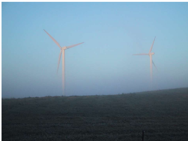
Vedvarende energi - en mærkesag for SF

SF vil arbejde målrettet og konsekvent på at vi kan videregive et sundt og godt miljø til vore efterkommere. De seneste undersøgelser viser, at børn har et større antal farlige stoffer i kroppen. De undersøgte voksne har færre, men en højere koncentration af de stoffer de har i kroppen. Det kan simpelthen ikke være rigtigt at snævre økonomiske interesser er vigtigere end vores miljø, og vores sundhedsmæssige forhold. Derfor er vi nødt til at føre en politik, der er bæredygtig for miljøet og ikke ødelægger naturen.